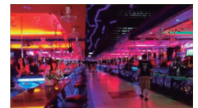
Lugares de entretenimiento